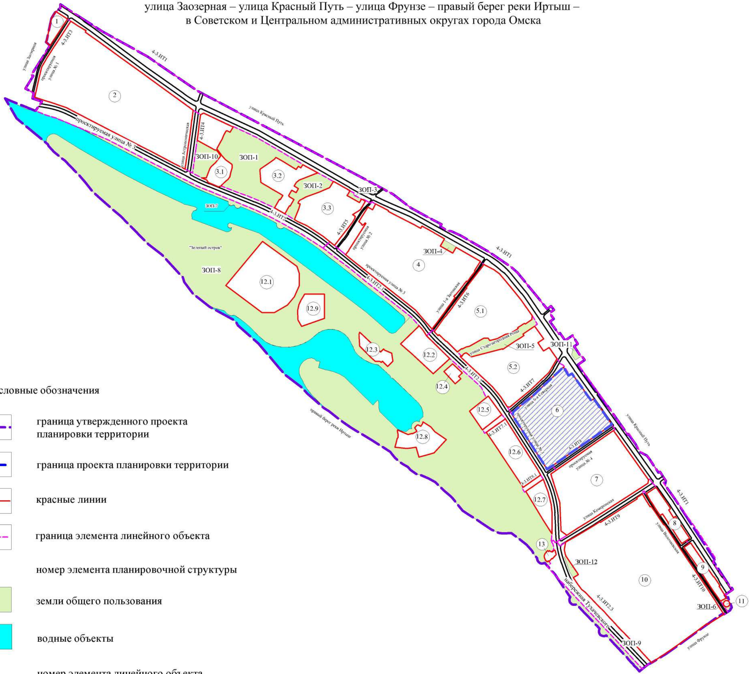
Схема расположения элементов планировочной структуры проекта планировки территории, расположенной в границах: улица Заозерная – улица Красный Путь – улица Фрунзе – правый берег реки Иртыш – в Советском и Центральном административных округах города Омска

Приложение № 2 к постановлению Администрации города Омска от _____ № _____